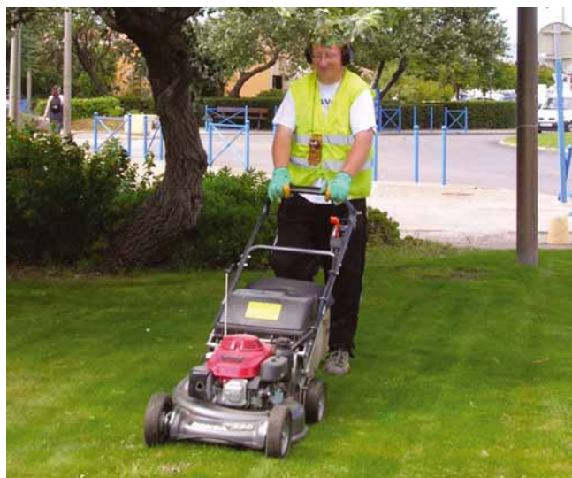
Les équipes espace vert de Castelnaudary