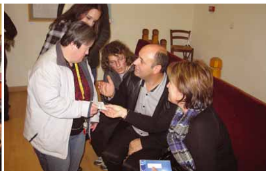
De nombreux tableaux ont été vendus