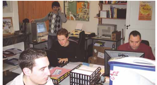
L'équipe de Résonance Communication à Trèbes travaille sur le projet

L'APAJH11 souhaite tout de même donner l'exemple !