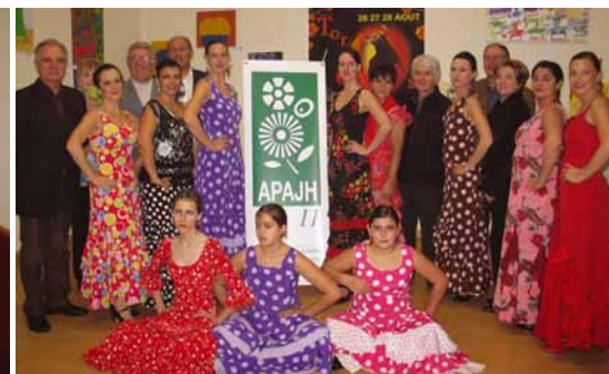
Les danseuses sévillane ont fait le show