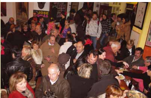
Un grand nombre de personnes a répondu présent

Événement à réitérer dans le futur, ça c'est sûr!