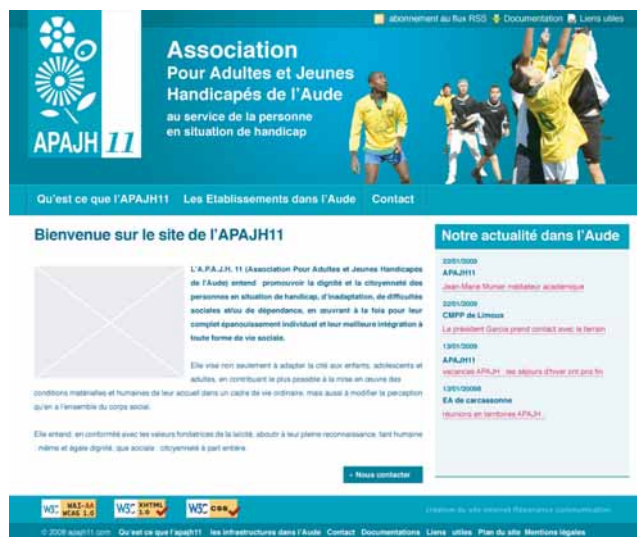
Maquette de la nouvelle version du site

Venez nombreux découvrir l'actualité de l'Association et ses établissements ! Bon surf !